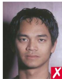
тень на фоне