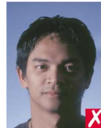
тень на лице