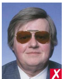
темные линзы очков