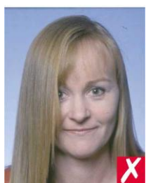
волосы закрывают глаза