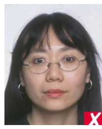
оправа закрывает глаза