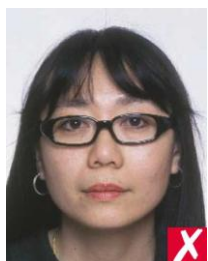
слишком массивная оправа