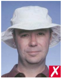
шляпа на голове