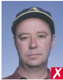
кепка на голове