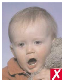
игрушка слишком близко к лицу