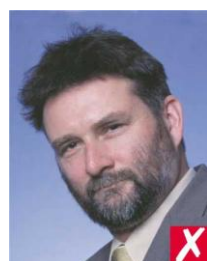
линия глаз под углом