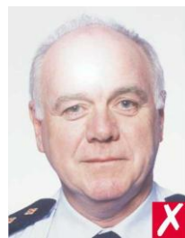
на коже рефлекс от вспышки