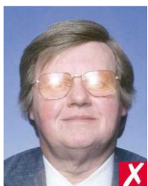
блики на линзах