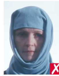
тени от платка на лице