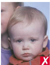
посторонний человек в кадре